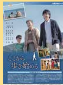
(公財)兵庫県人権啓発協会発行資料より転載

「認知症を共に生きる」をテーマに高齢者問題を人の幸せと尊厳を守るという人権の視点からとらえた作品。